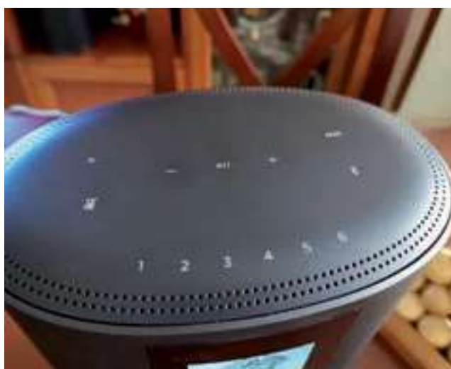
Los controles táctiles están situados en la parte superior. Bajo ésta se hallan los ocho micrófonos direccionales