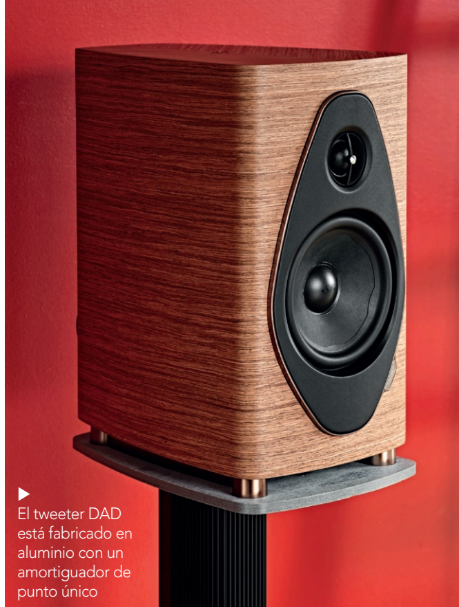
▶ El tweeter DAD está fabricado en aluminio con un amortiguador de punto único

Los materiales y los detalles constructivos son propios de modelos muy superiores, y en especial destaca la canalización del bass-reflex que respira por la base del recinto y se expande hacia el frente