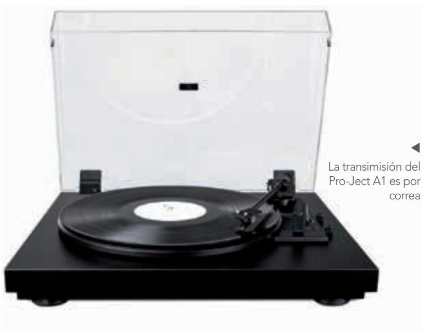
La transmisión del Pro-Ject A1 es por correa