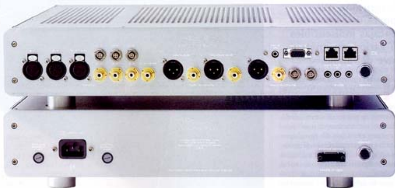
El panel posterior del Evolution Two incluye tomas balanceadas, no balanceadas y CAST. Recordemos que corresponde a un solo canal

Por cierto: la potencia de salida de cada Evolution One es de 450 vatios continuos en Clase A. Por lo demás, sólo queda esperar a que llegue a nuestro país el primer conjunto Evolution para poder escucharlo en compañía de "material adecuado" (Wilson Audio MAXX II o Alexandria X-2). Hasta entonces. ■