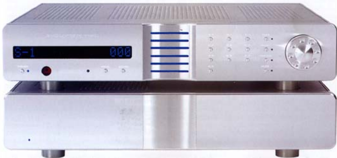
La solución radical al problema de la interferencia entre canales: un preamplificador, en este caso el Evolution Two, para cada uno.