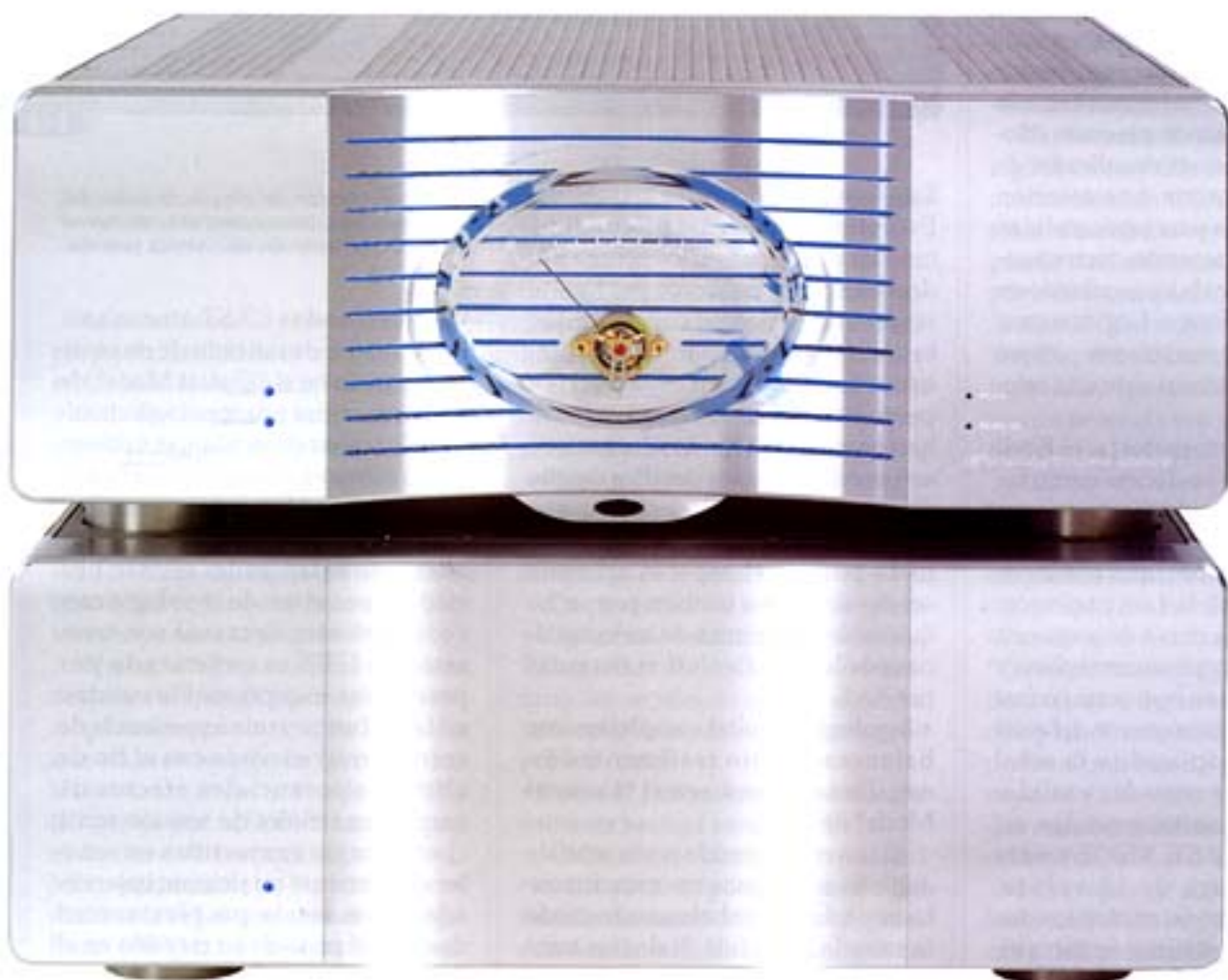
Seducción irresistible: la etapa de potencia monofónica Evolution One.

Las fotografías hablan por sí solas. Y la conclusión para cualquier "enfermo" que esté al día de los ava-