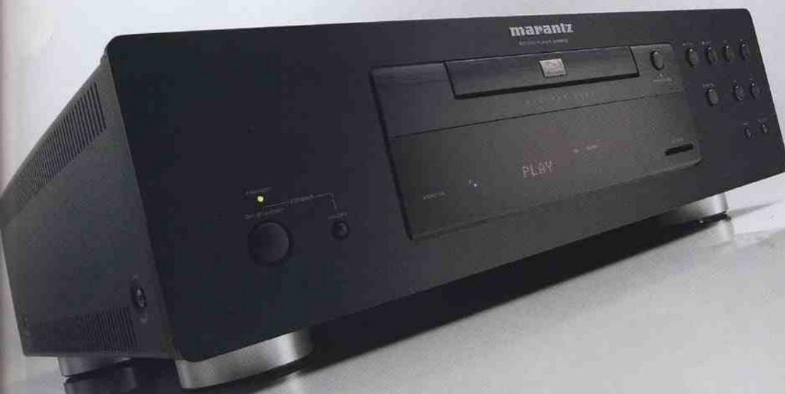
Dos modelos pensados para el Cine en Casa del futuro: el receptor de A/V SR5300 (arriba) y el opulento reproductor de Blu-ray Disc BD8200 (abajo).