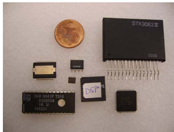
Algunos circuitos integrados (chips) usados en audio.