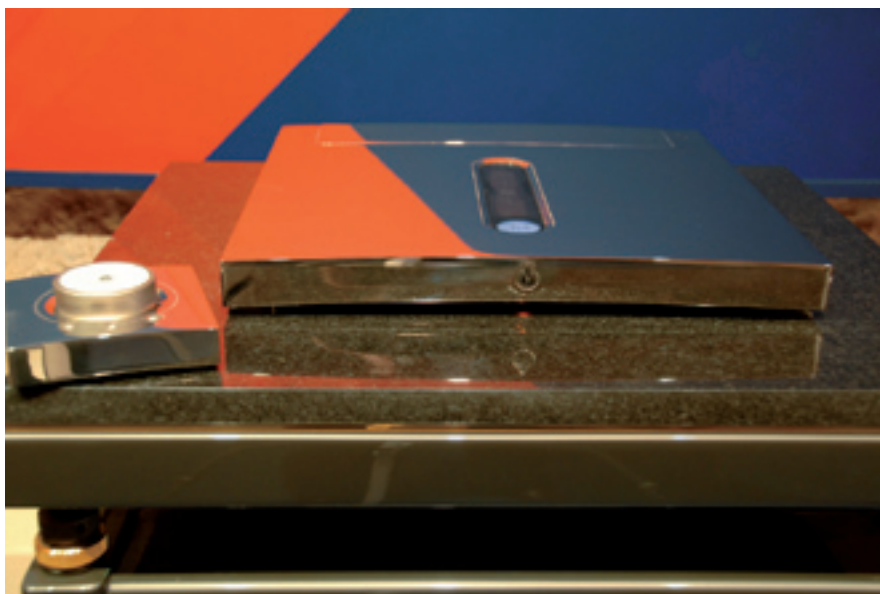
El Devialet D-Premier ha sido pensado para integrarse en los espacios más exclusivos y exigentes sin que ello se obtenga en detrimento de unas prestaciones fuera de serie.

PVP (excluyendo el ordenador): 44.000 euros Sarte Audio Elite 96 351 07 98