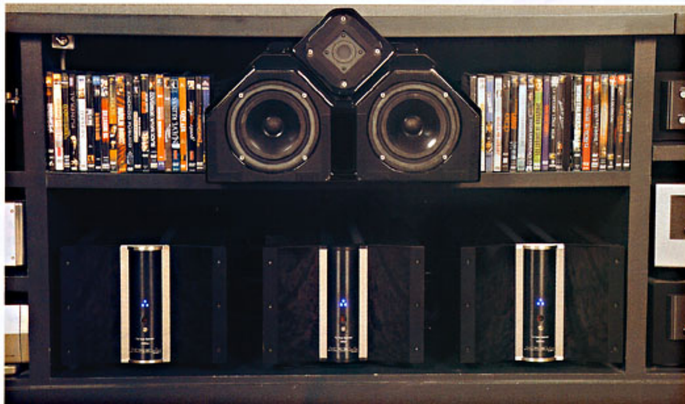
La "batería" de boques de potencia monofónicos de Krell impresiona. Su sonido, todavía más.

locutor en lo a reproducción musical se refiere es Audio Reference, establecimiento con el que mantiene una relación lo suficientemente profunda como para confiarle cambios que, créanme, en el caso concreto que nos ocupa son sencillamente espectaculares. Así, pues, dejo ya de marearles con mis consideraciones metafísicas y voy al grano, aunque no sin puntualizar que me concentraré sólo en las incorporaciones más relevantes puesto que en caso contrario necesitaría el doble de espacio.